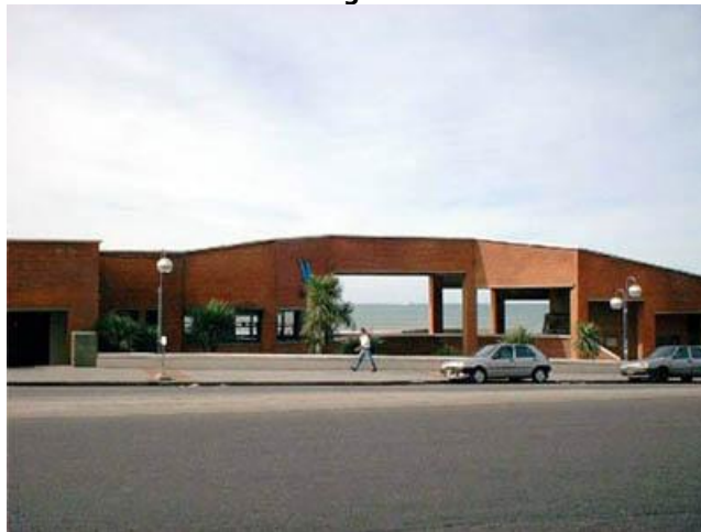
La ventana al mar desde la calle Balcarce.