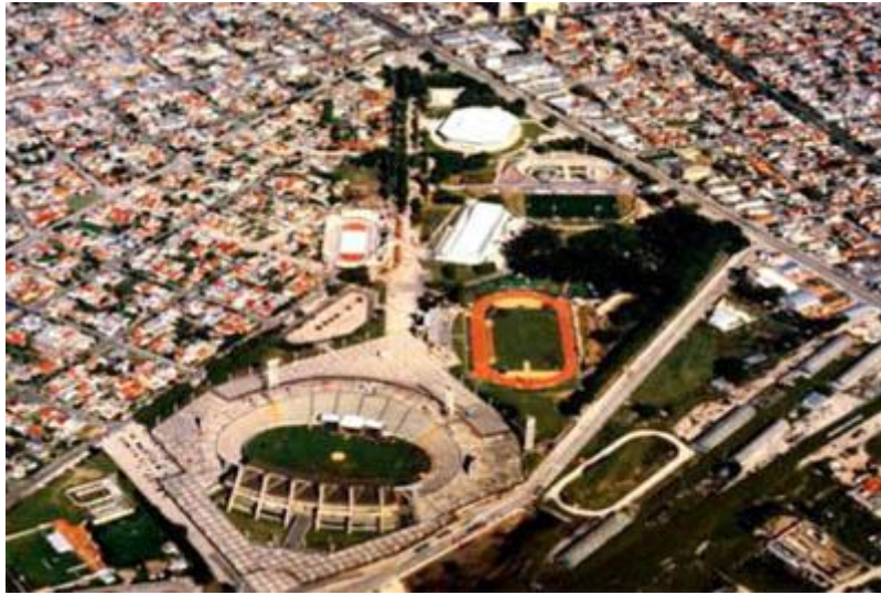
Vista Aérea del Campo de los Deportes