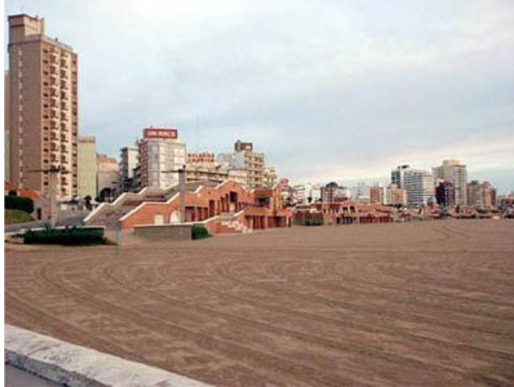
Los balnearios de La Perla en 2003.