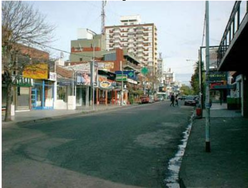
La calle Alem 2003.