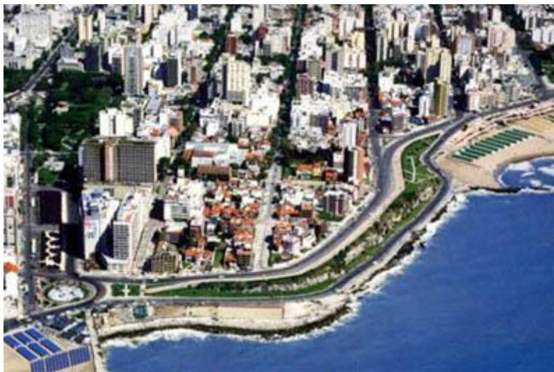
Vista aérea de Punta Iglesia.