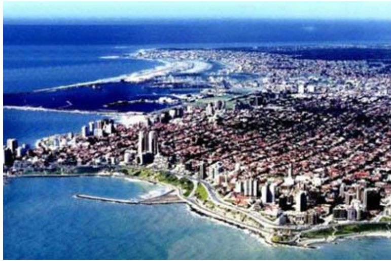
Vista aérea de la ciudad de Mar del Plata hacia el puerto.