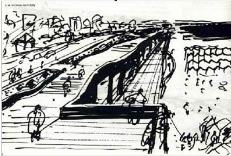
El paseo superior, en anteproyecto dibujado por Clorindo Testa.