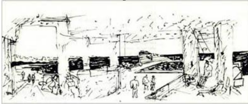
La ventana tal como la imaginó Clorindo Testa